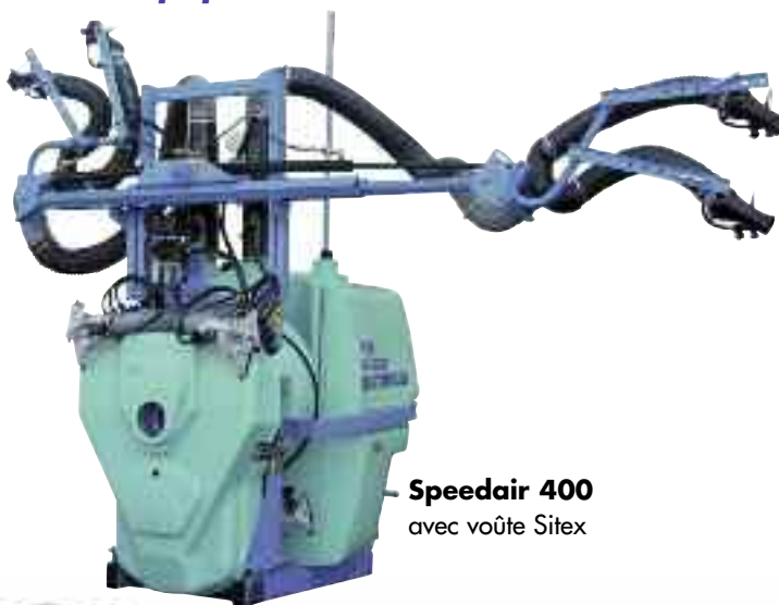
Speedair 400 avec voûte Sitex