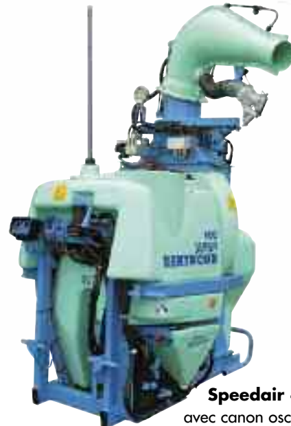
Speedair 400 avec canon oscillant