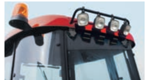
▲ Le gyrophare et les phares de travail pour voir et être vu.