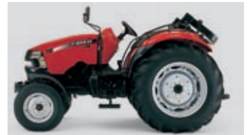
▲ L'arceau rabattable est indispensable pour les travaux où la hauteur est limitée.

Équipé pour la route et le travail de nuit. Afin de travailler en continu, jusqu'à six projecteurs de toit sont disponibles. Et pour la route, un gyrophare permet d'être bien vu dans la circulation.